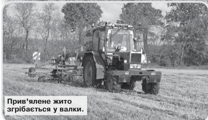
Прив'ялене жито згрібається у валки.

Нарешті ранкові заморозки та нічна холоднеча поступилися, слава Богу, теплу. Довгоочікуваному, вистражданому й такому бажаному. Бо таки, що не кажіть, а зима нинішнього року виявилася затяжною, тривалою й досить таки холодною. Вона ніяк не хотіла поступитися своїм місцем весні, отож прихід останньої не те, що уповільнився, а довгий час відкладався на майбутнє. Та, як кажуть, усьому приходить кінець. Настав він і для зяятої зими та геть небажаних весняних холодів. Потепліло, розвесніло, ожило все, зазеленіло. А невдовзі й справжні сонячні та щедри на тепло дні запанували. І природа ожила, оновилася, розквітла. Нарешті запанував і на полях, і на городах гам весняних робіт, який хоча й зарані благословився, та довго не міг набрати бажаних темпів.