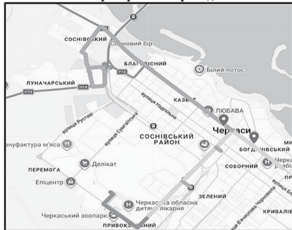
Безбар'єрний маршрут у Черкаській міській територіальній громаді

мобільних громадян, у Черкасах, зокрема, проживає 58621 особа похилого віку, 29576 осіб з інвалідністю, 974 — з інвалідністю внаслідок війни, понад 700 користуються колісним кріслом, 360 мають порушення зору.