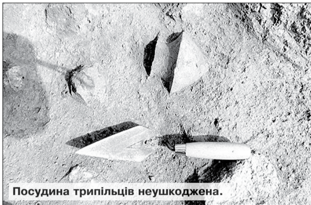
Посудина трипільців неушкоджена.

В и не замислювалися, скільки тисячоліть хазяйнують хлібороби на наших теренах? Ні? І я не задумувався. Та якось випадково почув із радіопередачі, що землеробством займалися ще мешканці поселень трипільської культури. Ось тоді й майнула думка, що ця фраза стосується безпосередньо рідної Черкащини. Бо на її теренах поселень цієї епохи — хоч греблю гати! Їх — не один десяток, а в них — залишків жител древніх хліборобів не те що сотні, а — тисячі.