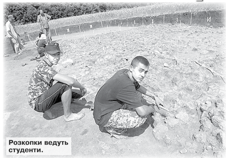
Розкопки ведуть студенти.

В и не замислювалися, скільки тисячоліть хазяйнують хлібороби на наших теренах? Ні? І я не задумувався. Та якось випадково почув із радіопередачі, що землеробством займалися ще мешканці поселень трипільської культури. Ось тоді й майнула думка, що ця фраза стосується безпосередньо рідної Черкащини. Бо на її теренах поселень цієї епохи — хоч греблю гати! Їх — не один десяток, а в них — залишків жител древніх хліборобів не те що сотні, а — тисячі.