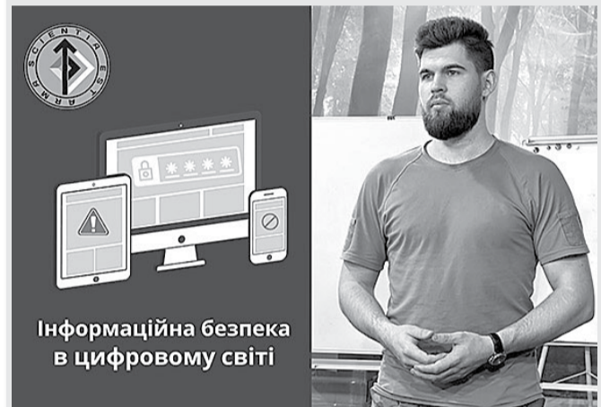
Інформаційна безпека в цифровому світі

Сам по собі цей метод не є чимось поганим — це потужний інструмент аналізу інформації. Але в руках ворога ця технологія перетворюється на небезпечну зброю. Зловмисникам не потрібно зламувати ваш телефон. Вони просто беруть цифрову інформацію, яку ви добровільно залишаєте в мережі, й складають із них детальний пазл вашого життя.