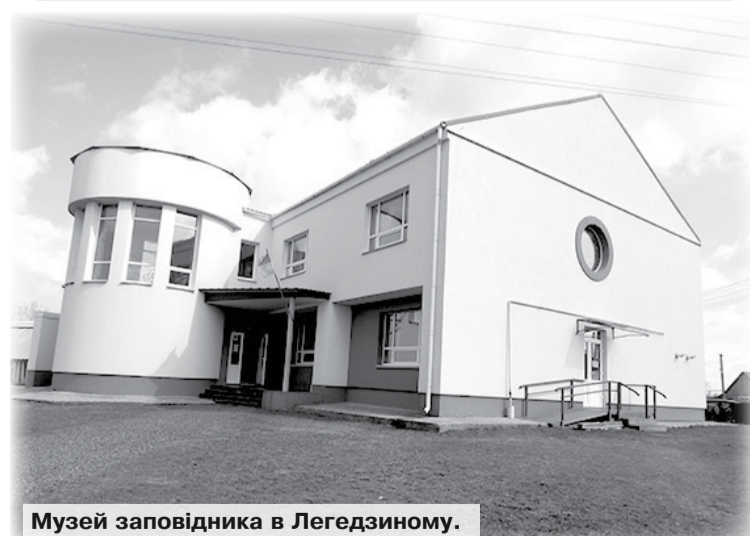
Музей заповідника в Легедзиному.

можна багато говорити, щось заперечувати, а ще більше — дивуватися. Але факт є фактом: хліборобство на наших землях існувало значно раніше, ніж на просторах різних імперій.