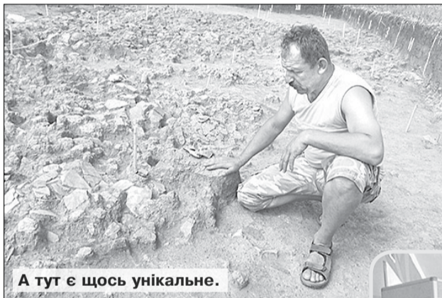
А тут є щось унікальне.