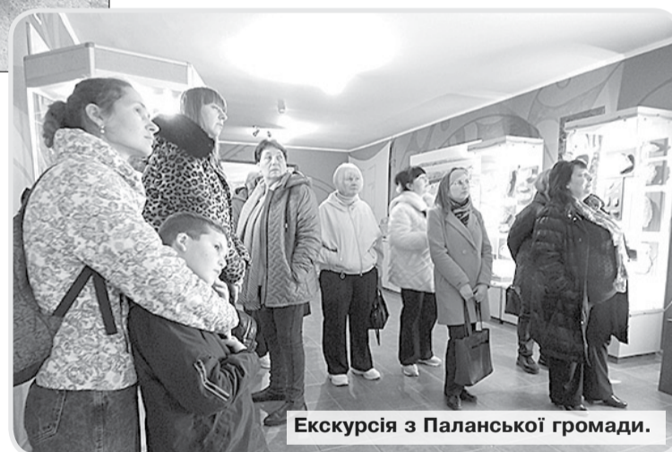
Екскурсія з Паланської громади.