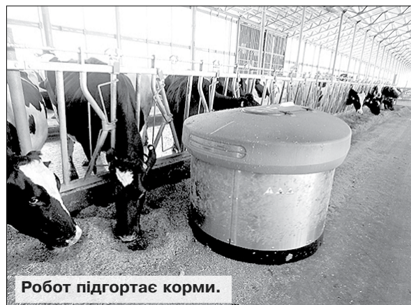
Робот підгортає корми.

молокоблочки, що надає можливість гарантувати високу якість наданого молока.