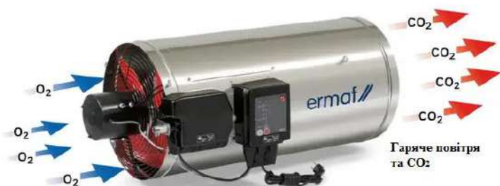
Рис. 1.2 – Зовнішній вигляд навісного теплогенератора GP-95

У процесі роботи теплогенераторів та під час надходження періодичного залпового викиду від свічок втрулявання газу (2 од.) до атмосферного повітря надходять: оксид вуглецю, оксиди азоту (оксид та діоксид азоту) у перерахунку на діоксид азоту, метан, вуглецю діоксид та азоту (1) оксид [N 2 O].