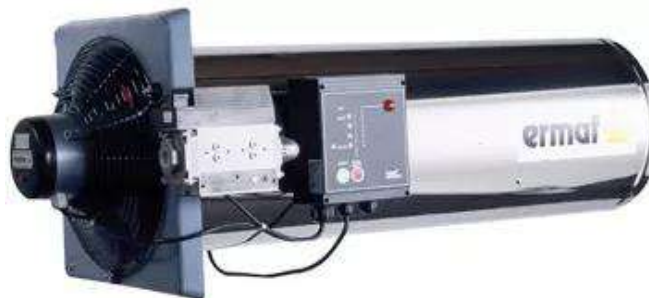
Рис. 2.2 – Зовнішній вигляд навісного теплогенератора GP-70

У процесі роботи теплогенераторів та під час надходження періодичного залпового викиду від свічок втравлювання газу (8 од.) до атмосферного повітря надходять: оксид вуглецю, оксиди азоту (оксид та діоксид азоту) у перерахунку на діоксид азоту, метан, вуглецю діоксид та азоту (1) оксид [N 2 O] (лінійні ДВ № 648-657).