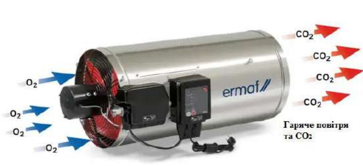
Рис. 1.2 – Зовнішній вигляд навісного теплогенератора GP-95

У процесі роботи теплогенераторів та під час надходження періодичного залпового викиду від свічок втравлювання газу (2 од.) до атмосферного повітря надходять: оксид вуглецю, оксиди азоту (оксид та діоксид азоту) у перерахунку на діоксид азоту, метан, вуглецю діоксид та азоту (1) оксид [N 2 O].