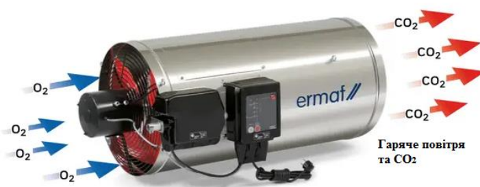
Рис. 2.2 – Зовнішній вигляд навісного теплогенератора GP-95

У процесі роботи теплогенераторів та під час надходження періодичного залпового викиду від свічок втравлювання газу (6 од.) до атмосферного повітря надходять: оксид вуглецю, оксиди азоту (оксид та діоксид азоту) у перерахунку на діоксид азоту, метан, вуглецю діоксид, азоту (1) оксид [N 2 O] та метилмеркаптан ( лінійні ДВ № 1-9 ).