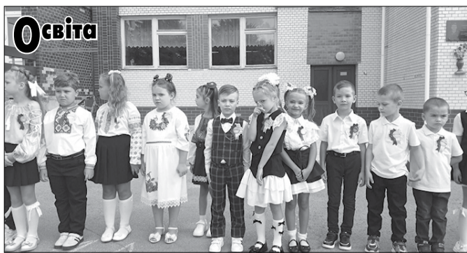
Фото з відкриття джерел.