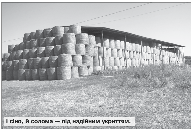
І сіно, й солома — під надійним укриттям.