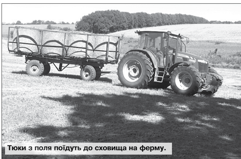
Тюки з поля поїдуть до схищці на ферму.

Василь МАРЧЕНКО, фото автора. с.Углуватка на Христинівщині