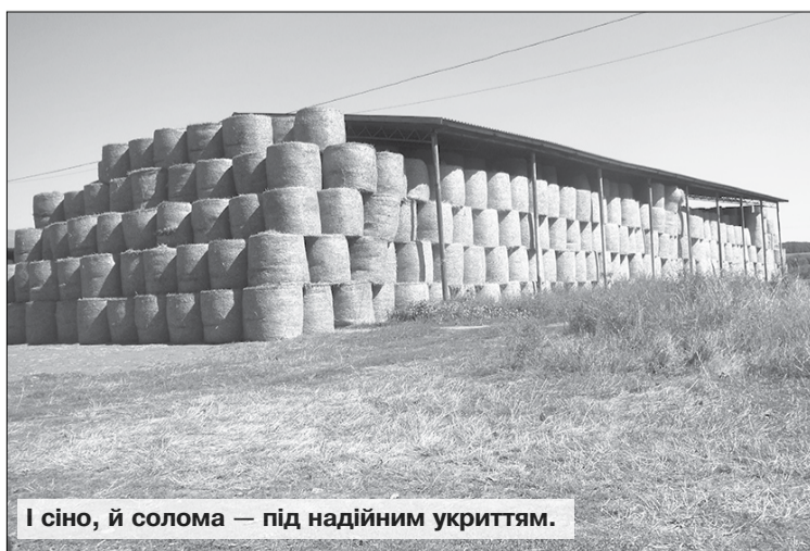
І сіно, й солома — під надійним укриттям.