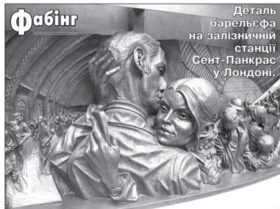
Деталь барельєфа на залізничній станції Сент-Панкрас у Лондоні.

Сучасні словники дають паралельно слова «коляска» й «візок». Це підтверджують і раніші російсько-українські словники. У Бориса Грінченка (словник 1909 року) є коляска, колясонька, колясочка, тут же приказка: ласка — не коляска: сівши, не поїдеш. У складі екіпажу подає також «коляса» (так само і словник 1898 року Уманця, Спілки). Кримський і Єфремов (1924-1933) зазначають, що для дітей — колясочка, повозочка. В Ізюмова (словник 1930): коляса, колясочка.