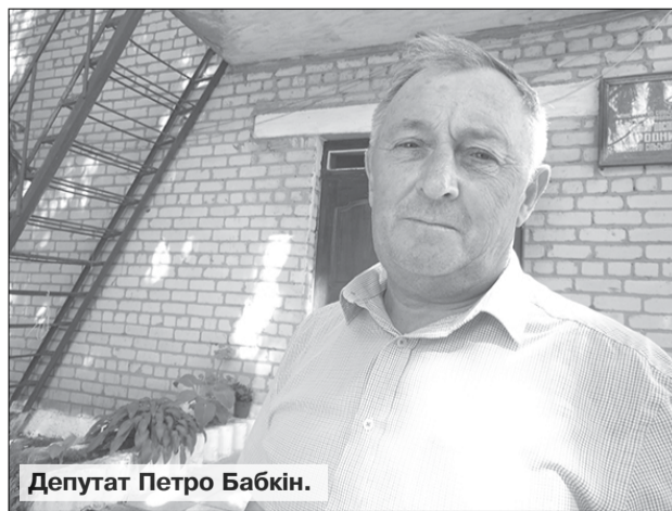
Депутат Петро Бабкін.