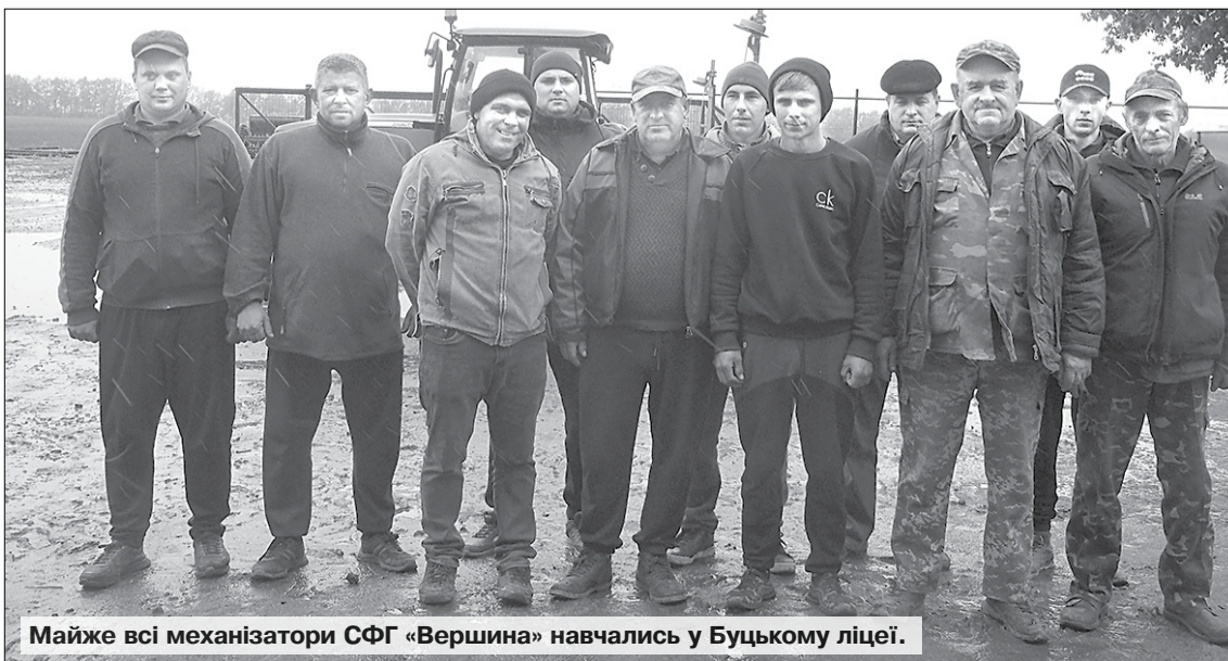
Майже всі механізатори СФГ «Вершина» навчалися у Буцькому ліцеї.