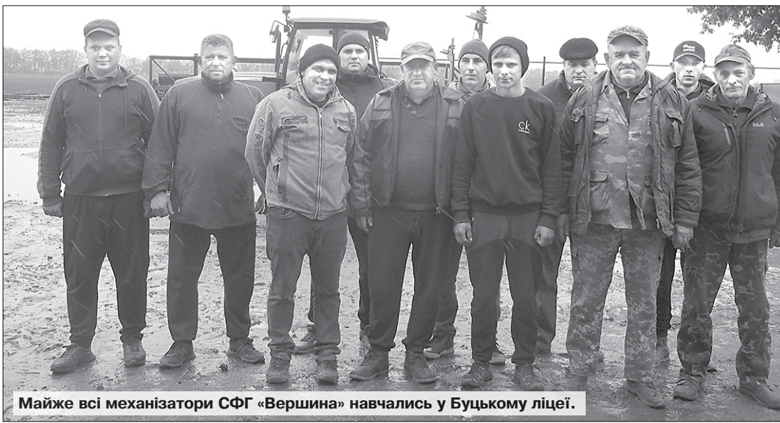
Майже всі механізатори СФГ «Вершина» навчалися у Буцькому ліцеї.