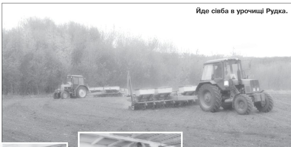
Йде сівба в урочищі Рудка.