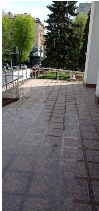
Зовнішній пандус. Вид з вул. Симоненка