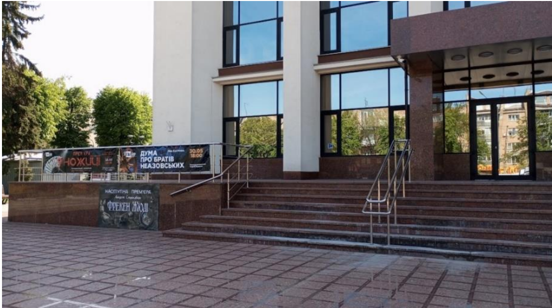
Головний вхід. Вид на зовнішній пандус.

Безперешкодний доступ до будівлі забезпечується зовнішнім і внутрішнім пандусами.