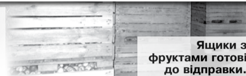
Ящики з фруктами готові до відправки.

На порозі — Різдво, а за ним — і Новий рік, отож господині нині в пошуках якісного й смачного до святкового столу. Звичайно, будуть там, як годиться, шампанське, цукерки, різні делікатеси. Чільне місце займатимуть і свіжі фрукти, зокрема цитрусові. Слава Богу, живемо не в пріснопам'ятні часи, то є можливість придбати мандарини, апельсини, лимони, хурму, банани, манго чи ананаси. Були б лишень гроші в гаманці, а екзотичні фрукти нині — не дефіцит. Будуть на святково накритих столах і рідні нам виноград чи лохина, яблука та груші.