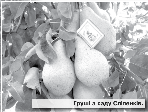
Груші з саду Сліпенків.

На порозі — Різдво, а за ним — і Новий рік, отож господині нині в пошуках якісного й смачного до святкового столу. Звичайно, будуть там, як годиться, шампанське, цукерки, різні делікатеси. Чільне місце займатимуть і свіжі фрукти, зокрема цитрусові. Слава Богу, живемо не в пріснопам'ятні часи, то є можливість придбати мандарини, апельсини, лимони, хурму, банани, манго чи ананаси. Були б лишень гроші в гаманці, а екзотичні фрукти нині — не дефіцит. Будуть на святково накритих столах і рідні нам виноград чи лохина, яблука та груші.