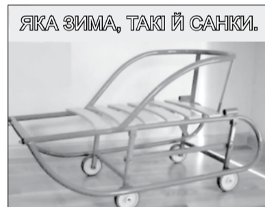
ЯКА ЗИМА, ТАКІ Й САНКИ.