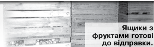
Ящики з фруктами готові до відправки.

На порозі — Різдво, а за ним — і Новий рік, отож господарі нині в пошуках якісного й смачного до святкового столу. Звичайно, будуть там, як годиться, шампанське, цукерки, різні делікатеси. Чільне місце займатимуть і свіжі фрукти, зокрема цитрусові. Слава Богу, живемо не в пріснопам'ятні часи, то є можливість придбати мандарини, апельсини, лимони, хурму, банани, манго чи ананаси. Були б лишень гроші в гаманці, а екзотичні фрукти нині — не дефіцит. Будуть на святково накритих столах і рідні нам виноград чи лохина, яблука та груші.