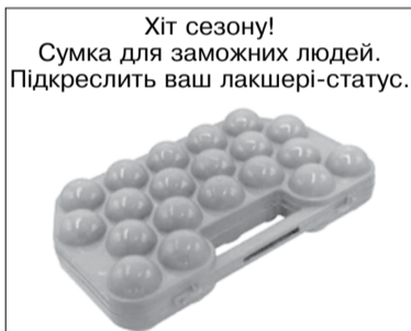
Хіт сезону! Сумка для заможних людей. Підкреслить ваш лакшері-статус.

Не хотілося б хвалитися, але 14-денну дієту я виконала за 4 години 27 хвилин.