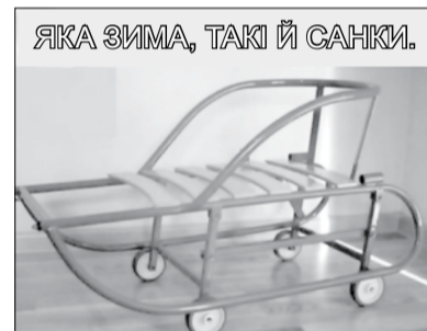
ЯКА ЗИМА, ТАКІ Й САНКИ.