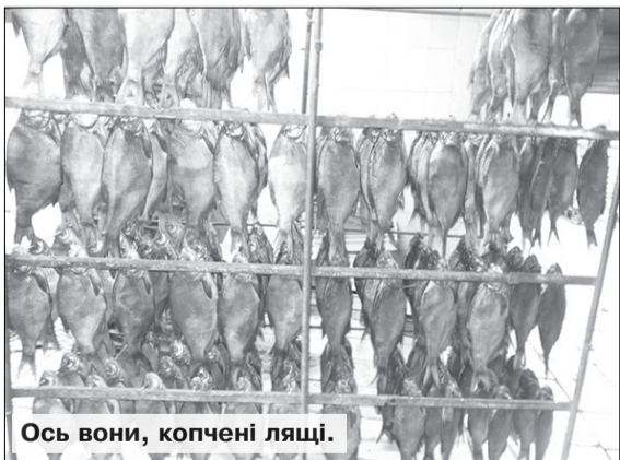
Ось вони, копчені лящі.