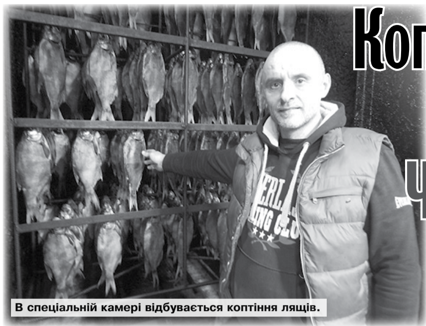
В спеціальній камері відбувається коптіння лящів.