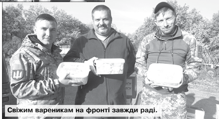
Свіжим вареникам на фронті завжди раді.