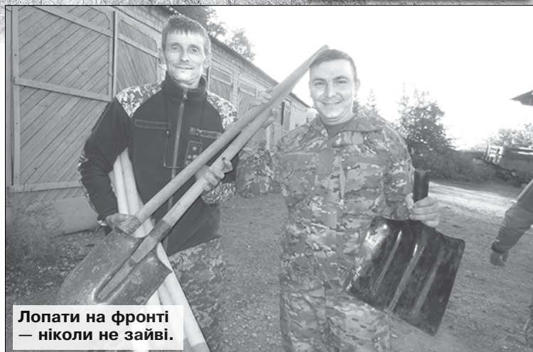
Лопати на фронті — ніколи не зайві.