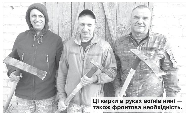
Ці кирки в руках воїнів нині — також фронтова необхідність.