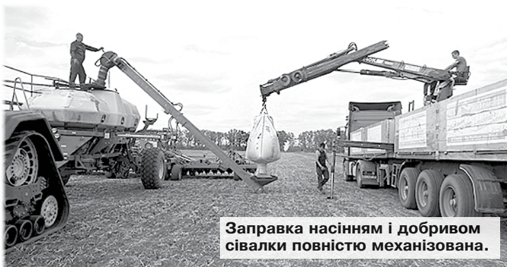
Заправка насінням і добривом сівалки повністю механізована.