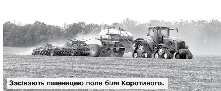
Засівають пшеницею поле біля Коротиного.

Ч и йду до черкаського шляху городами, чи хожу полями агропідприємств, — пильно дивлюся поперед себе на поверхню землі. Щоб випадково не потрапила моя паличка-ковінька в тріщину в ґрунті. Бо тріщин тих — не міряно й не злічено. Панує ґрунтова засуха, вологи катма не те що в орному шарі, а й до метрової глибини. Сохне все: і те, що сіялося, і бур'яни, яких ніхто ніколи не сів. Та цього року кепсько від браку вологи як пізнім зерновим та технічним культурам, так і невибагливим травам на узбіччях польових шляхів.