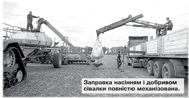
Заправка насінням і добривом сівалки повністю механізована.