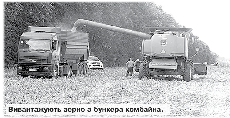
Вивантажують зерно з бункера комбайна.

Василь МАРЧЕНКО, фото автора. Шполянщина