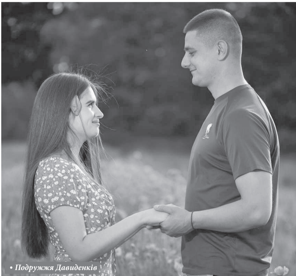
• Подружжя Давиденків

відомлення, швидко переросло у щось значно більше. Вже чотири роки вони разом, два з яких – чоловік і дружина. І незабаром, 5 жовтня, подружжя святкуватиме свою другу річницю шлюбу.