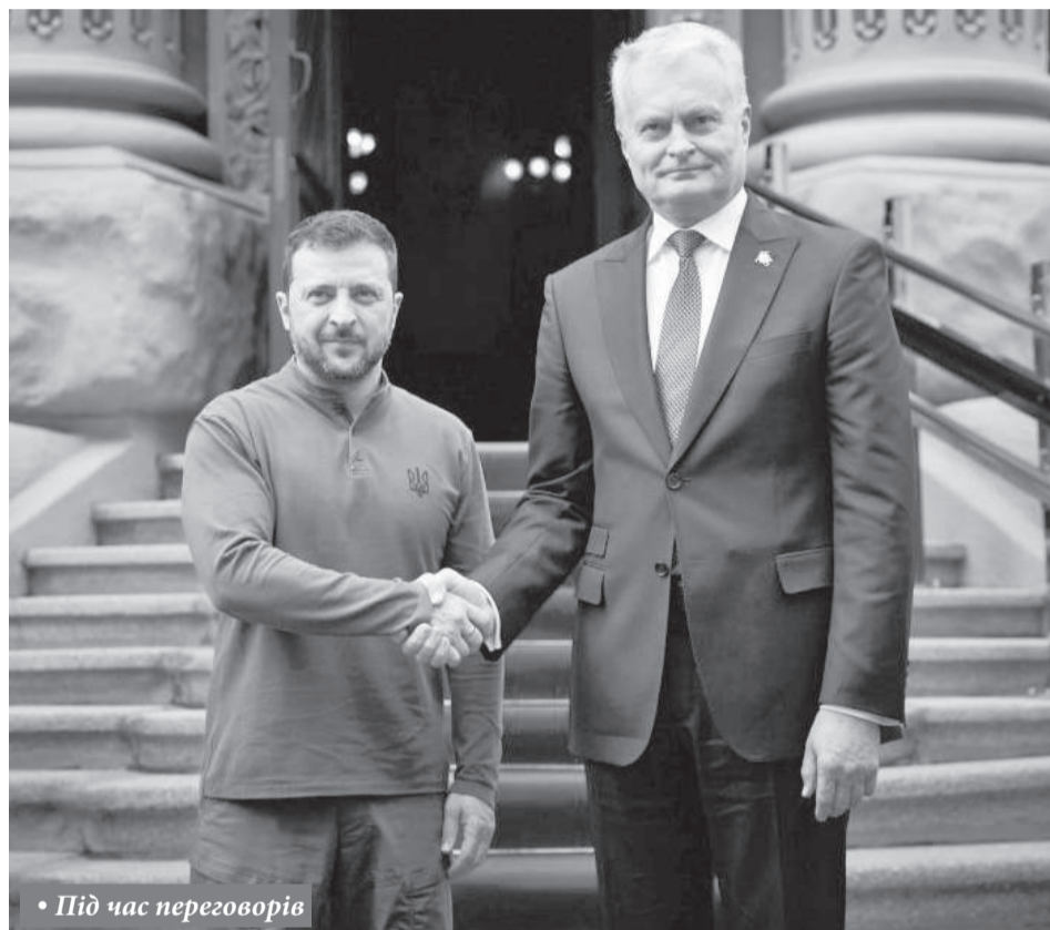
• Під час переговорів