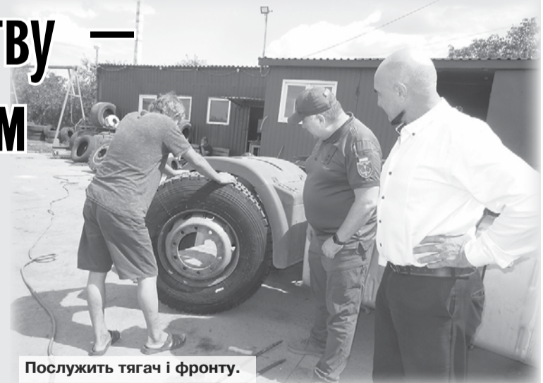
Послужить тягач і фронт.

Ця несподівана новина мене заінтригувала, я вирішив довше побути з очільником КСП і побачити як тягач, так і тих, хто його готує до передачі й хто прийме дарунок. МАН виявився дбайливо доглянутий.