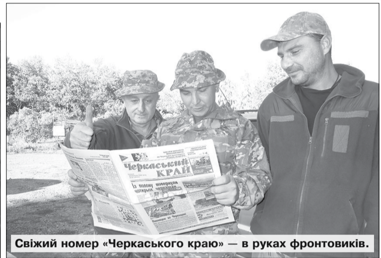
Свіжий номер «Черкаського краю» — в руках фронтовиків.

Та чим ближче до фронту, тим чіткіше проглядається на тутешніх ланах подих війни. Бо стернища обмолочених влітку пшениць, поля сірого соняшнику та пожовклої кукурудзи, потемнілі від спеки клапті необробленої землі все більше мережать протитанкові рови, нові траншеї та окопи. Збройні сили готують запасні позиції. Про всяк випадок. Бо ворог невпинно сіє наліво й направо смерть і біду. Тож наші бійці мусять дбати і про бойові позиції на «передку», і про тил. Бо кінця й краю навалі москвитів поки що не видно.