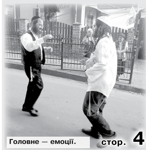
Головне — емоції.

Втім, є очікування, що на святкування іде удвічі більше паломників, ніж торік. І міська влада Умані запевняє, що бомбосховищ на випадок ракетних атак повинно вистачити. Частина з них розміщена в зоні паломництва, решта — по всьому місту.