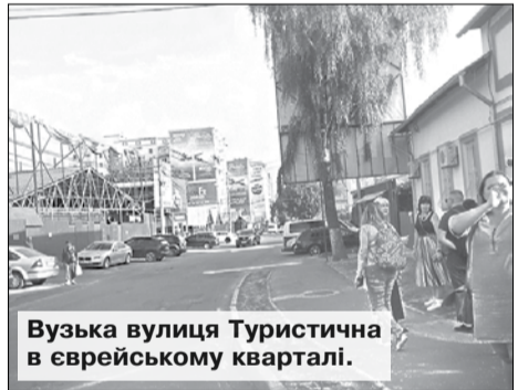
Вузька вулиця Туристична в єврейському кварталі.