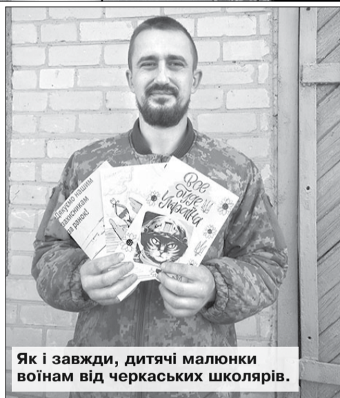
Як і завжди, дитячі малюнки воїнам від черкаських школярів.

Загалом цю поїздку готував гетьман Українського козацтва Віталій Чепелуха, який подбав, щоб і