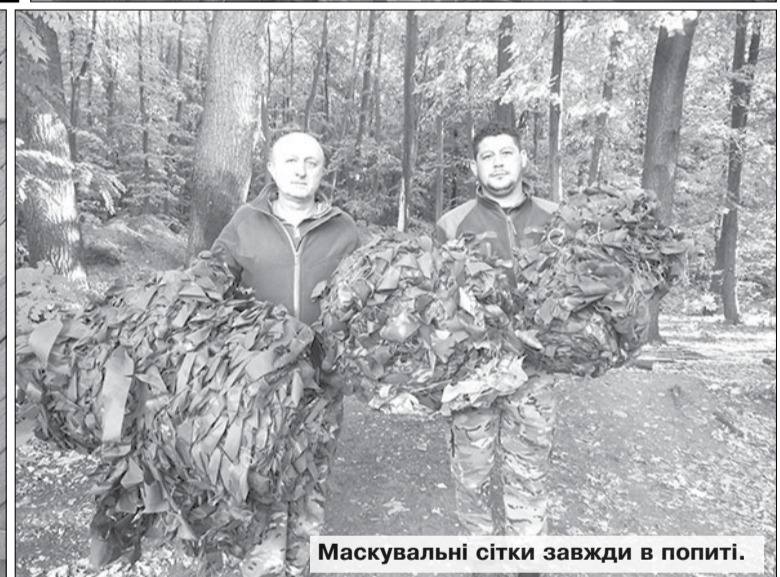
Маскувальні сітки завжди в попиті.