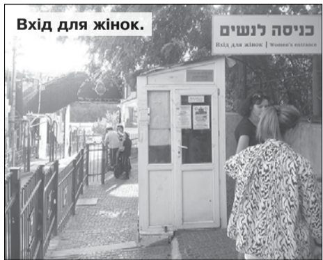
Вхід для жінок.

За три десятиліття в Умані сформувалася туристична індустрія, орієнтована на потреби євреїв. На вулиці Туристичній, центральній у єврейському кварталі, сучасні будівлі витіснили традиційну забудову. Мікрорайон нагадує квартали єврейських міст: будівлі синагог, готелів та хостелів, які приймають паломників, написи іноземними мовами. На багатопверхових готелях розміщені великі плакати на ідишу. На дахах деяких із них встановлені вертолітні майданчики. Щоправда, під час війни вони не використовуються.