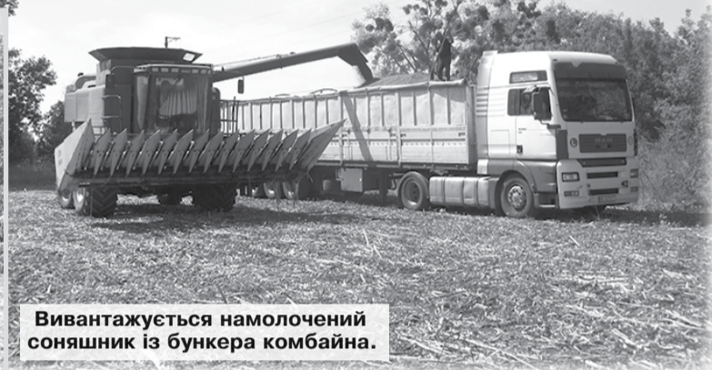
Вивантажується намолочений соняшник із бункера комбайна.

Поля між селами Філіція та Попівка давно не бачили дощу. Але іншу пізню культуру — кукурудзу — виручило те, що про неї в СФГ «Яблуневий цвіт» подбали так, як слід. Мається