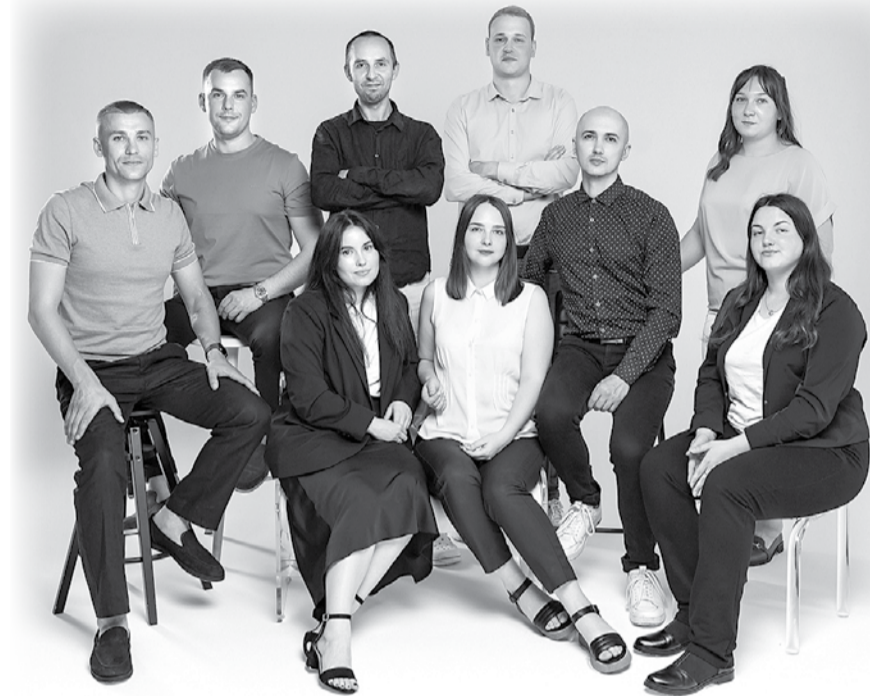
Експерти компанії «Доброзем».

Відкриття ринку землі в 2021 році створило нові можливості для перетворення сільськогосподарської землі у стабільний прибуток. Підтверджують це актуальні цифри: за три роки діяльності середньозважена ціна на землю становить 43 582 грн за гектар. До прикладу, вже з моменту відкриття ринку в певних регіонах ціна сягала 35 211 грн за гектар. Лідерами з купівлі/продажу ділянок за останній рік стали Полтавська, Дніпропетровська, Львівська та Харківська області.