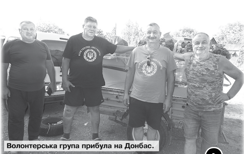
Волонтерська група прибула на Донбас.