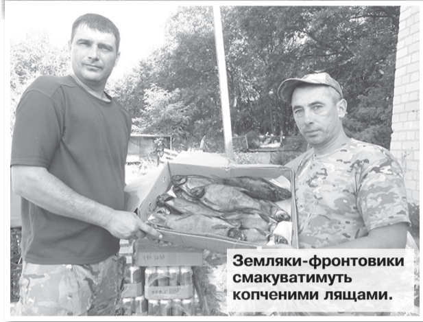
Земляки-фронтовики смакуватимуть копченими лящами.