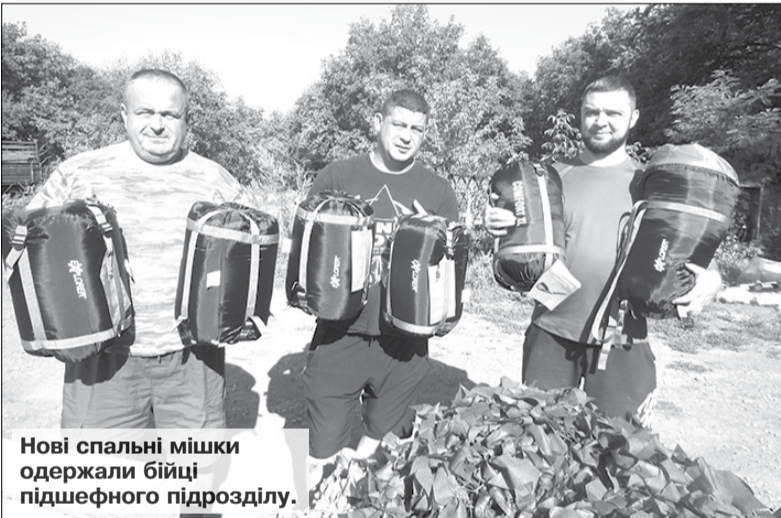
Нові спальні мішки одержали бійці підшефного підрозділу.

Аномальна спека нинішнього літа добряче далася взнаки і людям, і природі. Селяни й міські жителі відчують величезний дисконфорт від температури, яка мало не щодня сягає в полуденну пору 40 і більше градусів у затінку. Пожовкли трави, сохне листя на кущах та деревах, передчасно пожухла городина. Асфальт, розпечений під сонцем, вгинається під колесами вантажівок, а на горизонті — розжарена дорога блищить, мов повноводна річка. Не витримує й перегрітий бетон тих плит, якими подекуди вимощені дороги на Донбасі.