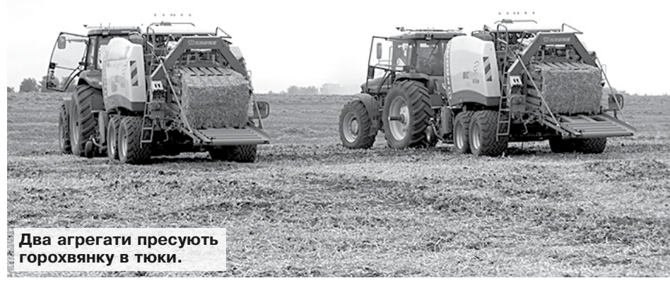
Два агрегати пресують горохвянку в туки.

Василь МАРЧЕНКО, фото автора. Уманський район