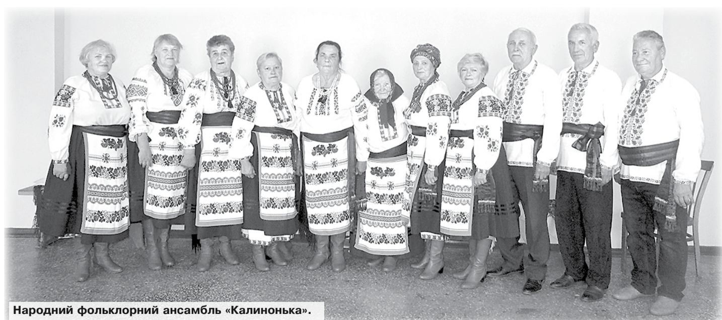
Народний фольклорний ансамбль «Калинонька».