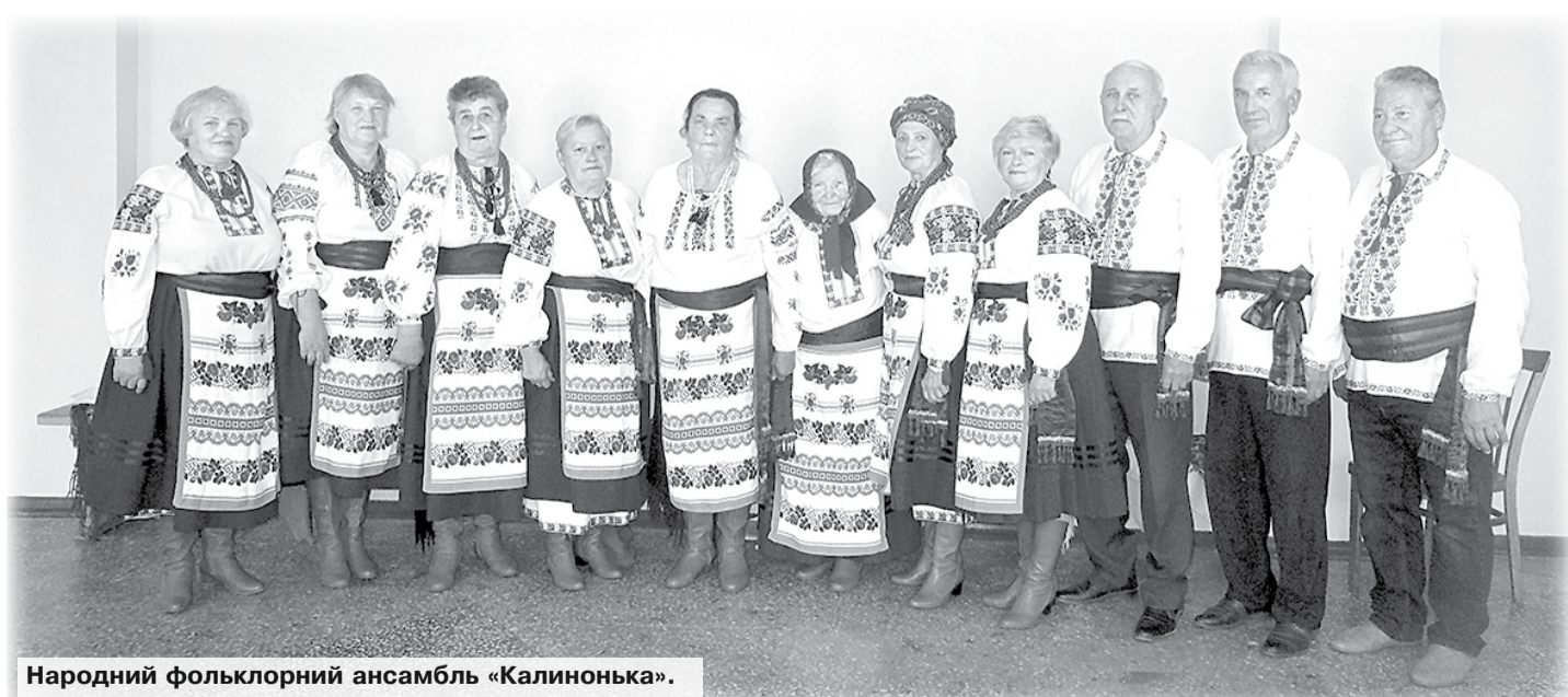
Народний фольклорний ансамбль «Калинонька».