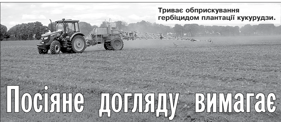
Триває обприскування гербицидом плантації кукурудзи.