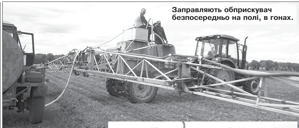
Заправляють обприскувач безпосередньо на полі, в гонах.