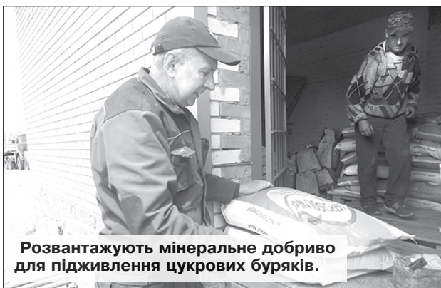
Розвантажують мінеральне добриво для підживлення цукрових буряків.

— Нові технології вирощування, що прийшли на зміну старим, диктують дещо інший хід робіт. Це, насамперед, заслін хворобам та шкідникам рослин, боротьба з бур'янами. Бо довгождане тепло, яке, зрештою, настало, сприяє не лише розвитку посівів, а й активізувало прояви хвороб. На світ Божий рушили й шкідливі комахи, проростають і бур'яни. Тому зараз