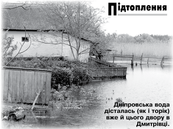
Дніпровська вода дісталась (як і торік) вже й цього двору в Дмитрівці.