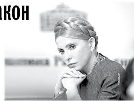
дальний варіант закону про мобілізацію.

Цей факт загально і вплинув на рішення фракції не голосувати за скан-