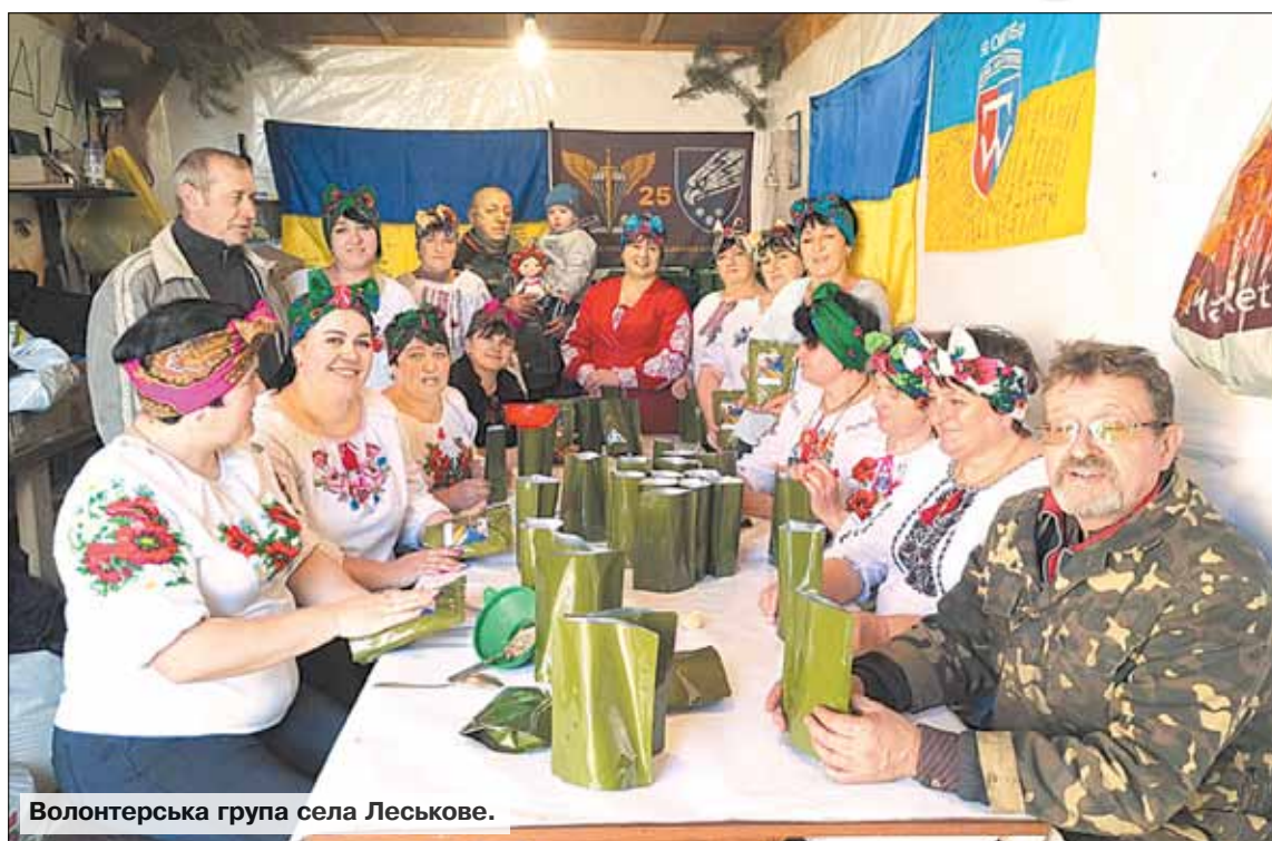
Волонтерська група села Леськове.

лучалась міськрада й до ремонту деяких із них, фарбування. В різних випадках ця участь буває різною, але жодне звернення не було забуте чи пропущене.