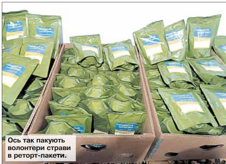
Ось так пакують волонтери страву в реторт-пакети.