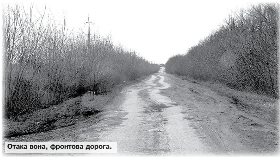
Отака вона, фронтowa дорога.

Василь МАРЧЕНКО, фото автора. Фронтowa Слобожанщина