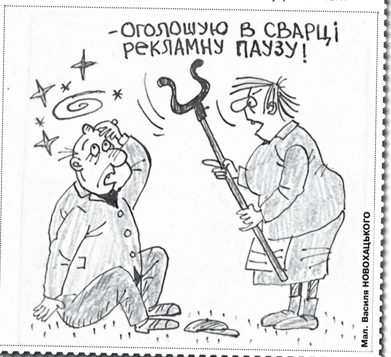
Мал. Василія НОВОХАЦЬКОГО

— Дівчино, нам цікавий лише ваш внутрішній світ.