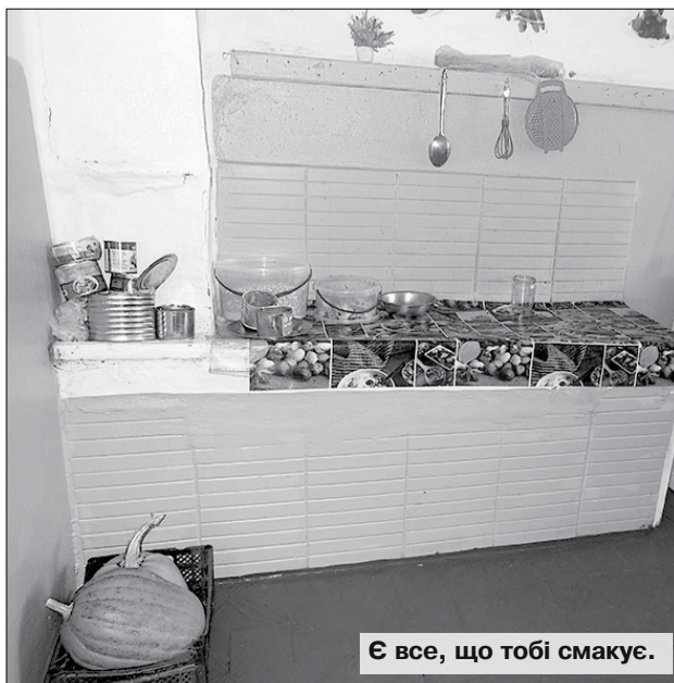
Є все, що тобі смакує.