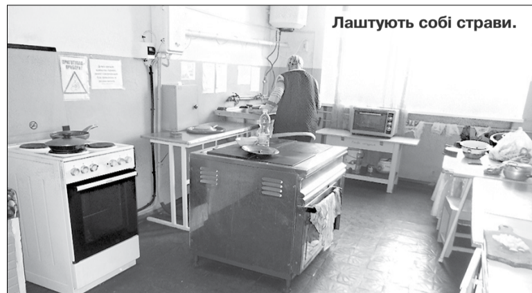
Лаштують собі страви.