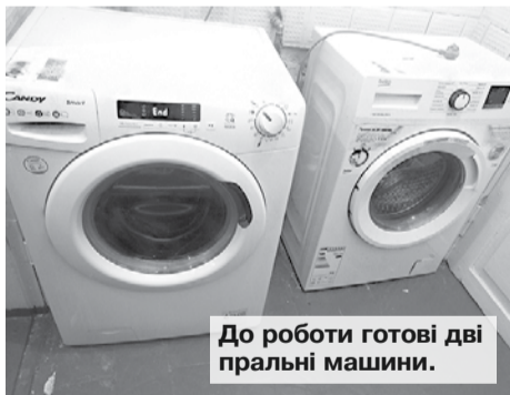
До роботи готові дві пральні машини.

Це якраз він поламав долі людям, спричинив чимало великих бід і закинув у Шевченків край. Хтось із них позбувся свого житла, яке розтрощили вибухи снарядів та ракет окупантів, а в когось загинули найрідніші люди — батьки, діти, внуки чи племінники. Не маючи, як мовиться в тій приказці, «ні кола, ні двора», переселенці, втративши своїх близьких, поїхали з охоплених ворожим вогнем населених пунктів багатостраждального Донбасу подалі від вибухів, пострілів, прильотів, смерті та пожеж, подалі від лиха.