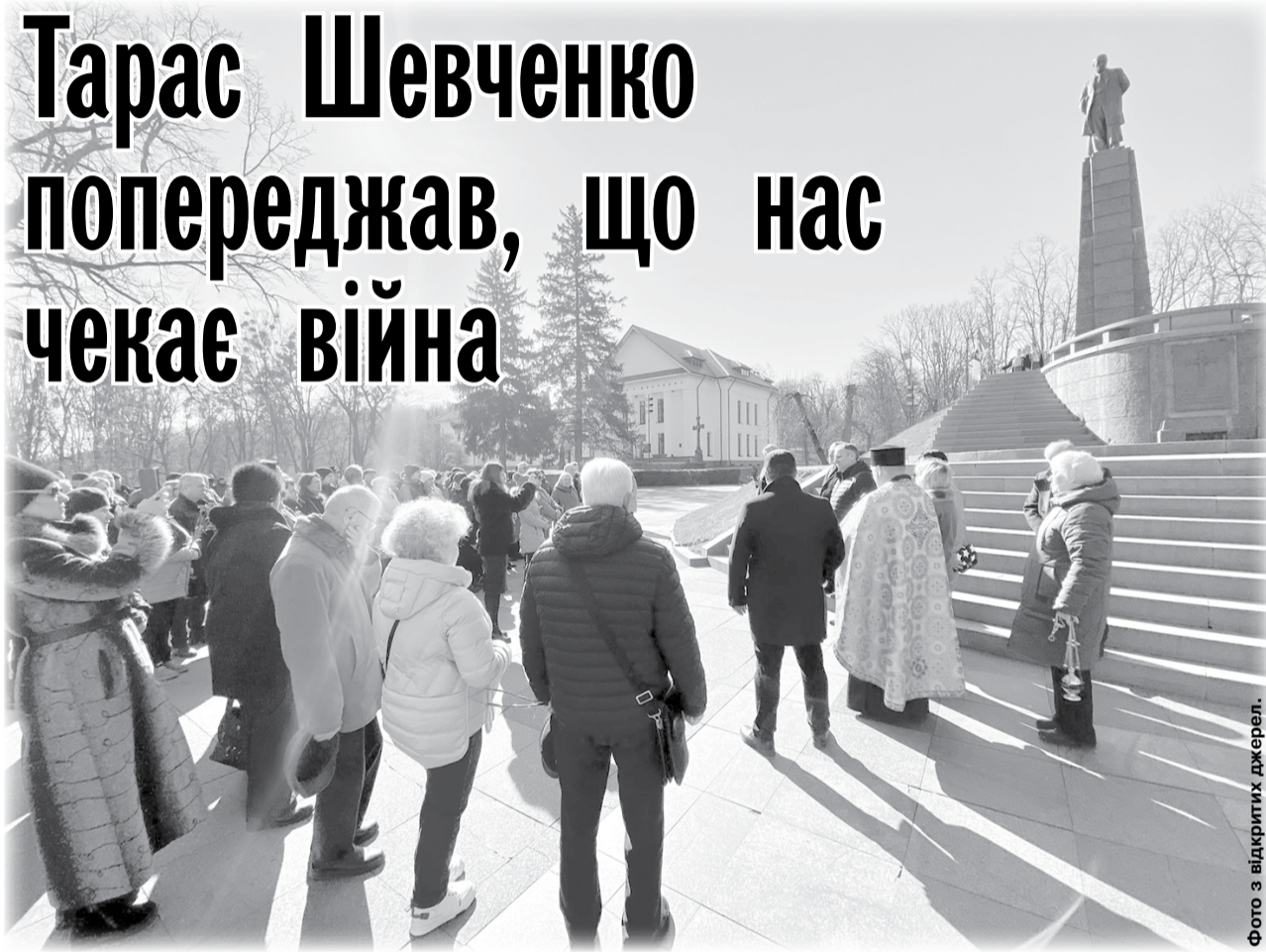
Фото з відкритих джерел.