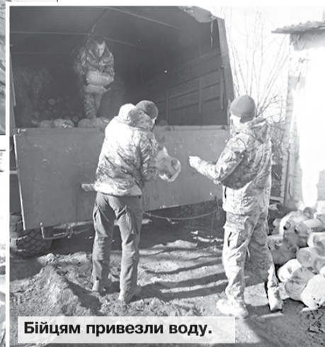
Бійцям привезли воду.