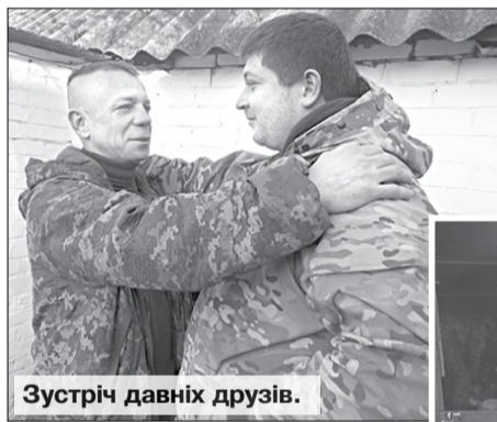
Зустріч давніх друзів.