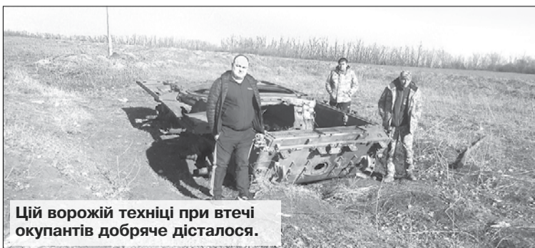
Цій ворожій техніці при втечі окупантів добряче дісталося.

Василь МАРЧЕНКО, фото автора. Слобожанщина