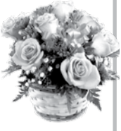
Щиро — журналісти «Черкаського краю»

Ми вас вітаємо з цим святом І бажаємо радості багато: Хай сміється сонце у Монастирищі з неба, І троянда в «Юності» розквітає як треба. Нехай дощі весняні принесуть здоров'я, Проміння сонячне торкає за вуста. Хай внуки зустрічають вас любов'ю, Бажаєм довгого й успішного життя!