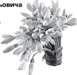
Щиро — журналісти «Черкаського краю»

З днем народження щиро вітаємо, Зичим щастя, здоров'я, добра. А у Бога в молитвах благаємо, Щоб беріг вас на фронті щодня! Дай вам Боже доброї долі, І достатку в Бурімці в домівці. І спокою на ратному полі. Вірних друзів по зброї доволі.