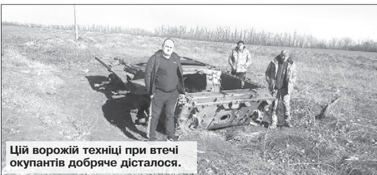
Цій ворожій техніці при втечі окупантів добряче дісталося.

Василь МАРЧЕНКО, фото автора. Слобожанщина