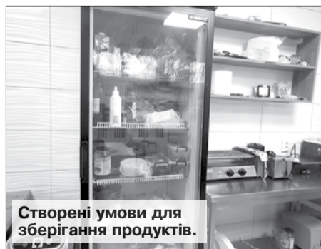
Створені умови для зберігання продуктів.