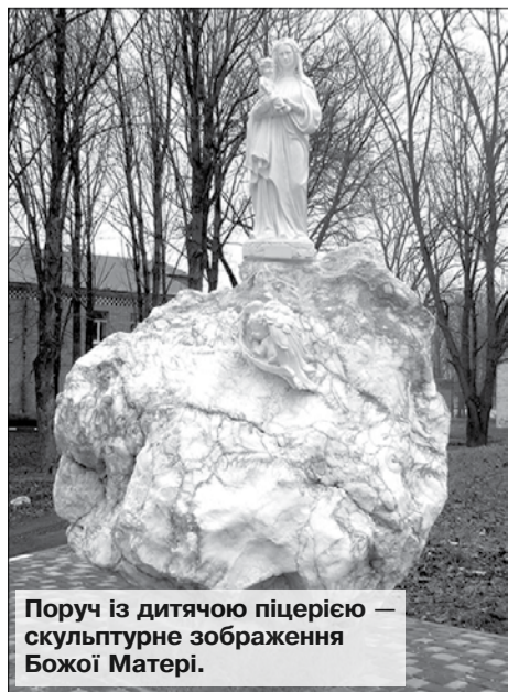
Поруч із дитячою піцерією — скульптурне зображення Божої Матері.