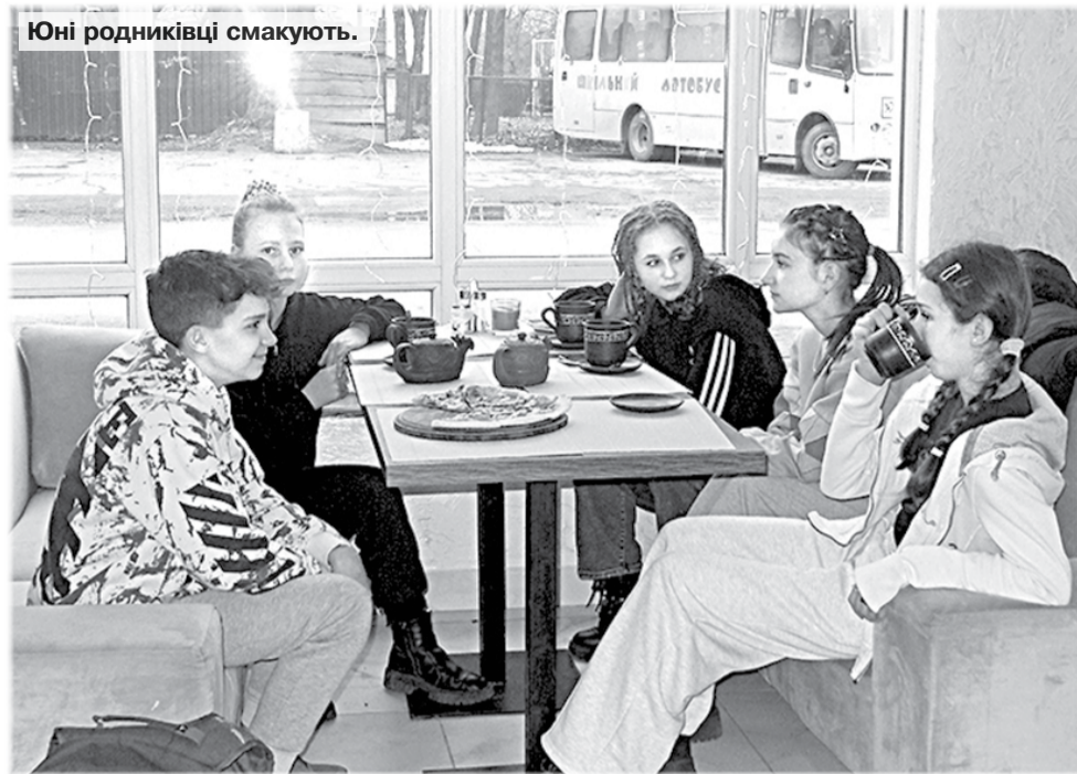
Юні родниківці смакують.