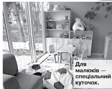
Для малюків — спеціальний куточок.

Таке розташування для дитячої піцерії — зручне для малечі. Тепер не потрібно для того, щоб посмакувати піцою, їхати, хай і в недалеку, Умань, а