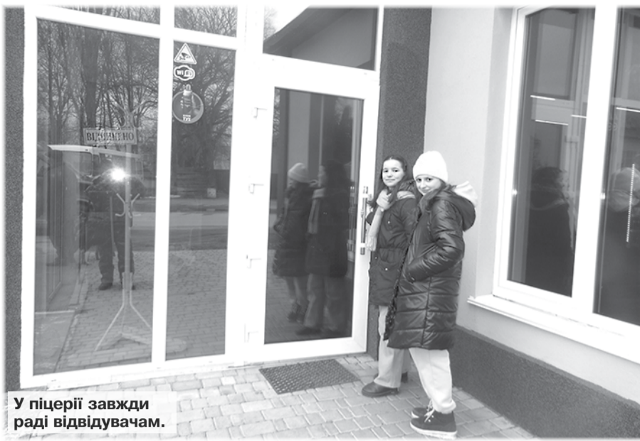
У піцерії завжди раді відвідувачам.