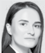
Анастасія ЧУБИНА, заступниця міського голови:

Чула, що в Черкасах з наступного року відновлять безоплатне харчування в школах для всіх учнів молодших класів. Чесно кажучи, мало віриться, що це вже так потрібно. Діти ж цей рік якось жили без цього харчування.