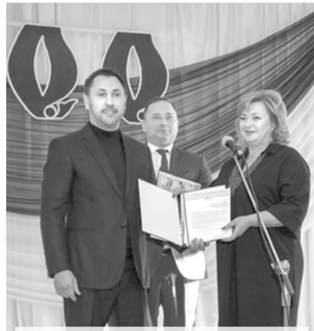
Викладачів і студентів привітали народні депутати України Андрій Стріхарський і Валентин Колюх, колишній випускник закладу.