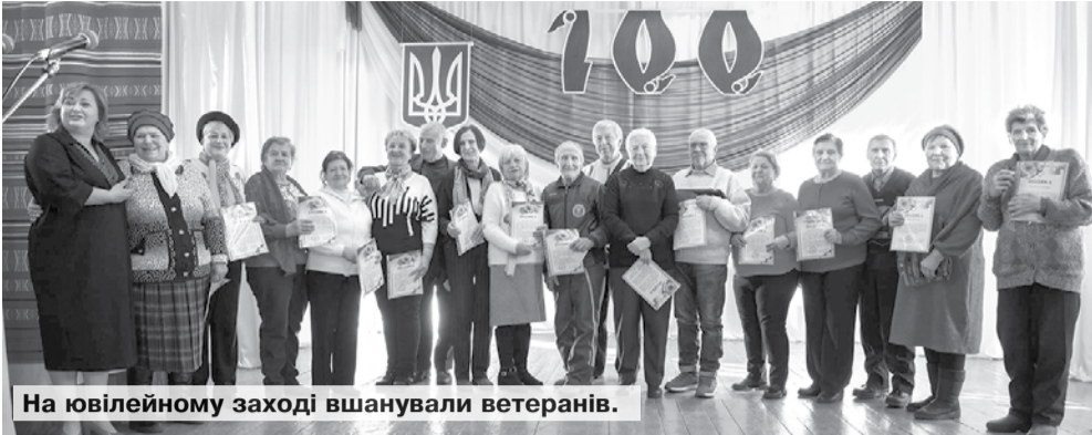
На ювілейному заході вшанували ветеранів.

У листопаді чудовий ювілей — 100-річчя від дня заснування — відзначив Корсунь-Шевченківський педагогічний фаховий коледж ім. Т.Г.Шевченка Черкаської обласної ради.