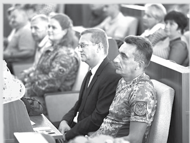
чаткували проект «Моя Черкащина» для патріотичного виховання шкільництва.

Освіта під час війни — складне випробування, яке ми разом долаємо, — наголосив він про ситуацію в галузі. — Ми при звичаємо до нових реалій і укріплюємося, нарощуємо фонд захисних споруд, аби учні з педагогами були забезпечені. На сьогодні уже 97% закладів освіти мають змогу працювати очно або у змішаному форматі. Водночас на Черкащині й далі успішно реалізують обласні освітні програми. Зокрема «Інноваційні школи». Їх немає аналогів в Україні. Також в області запо-