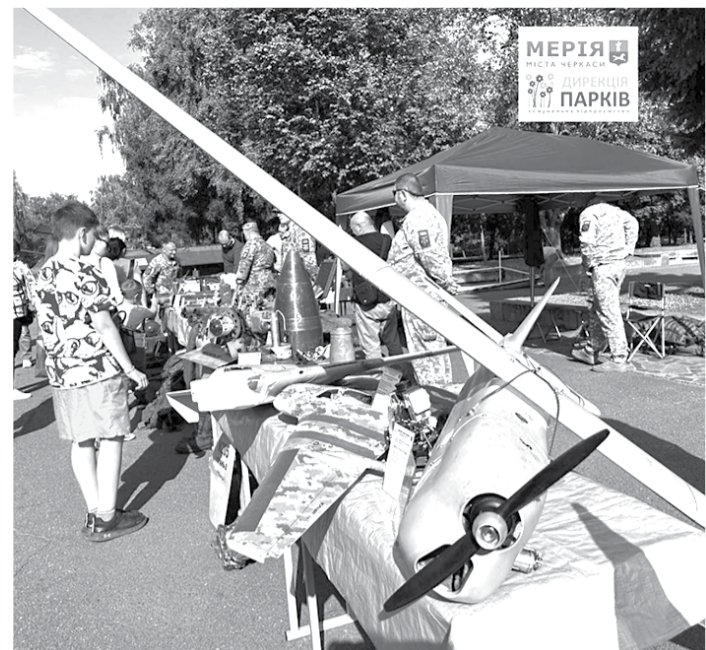
У День захисників і захисниць, День козацтва та Покрови у парку «Перемога» відкрили виставку підбитої російської техніки.

Танки, бронемашини, артилерійські системи, БМП та інша техніка була знищена на найважчих напрямках фронту. А зараз її можна побачити в Черкасах.