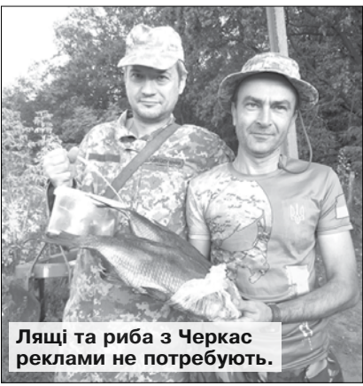
Лящі та риба з Черкас реклами не потребують.

Василь МАРЧЕНКО, фото автора. Фронтowa Донецчина