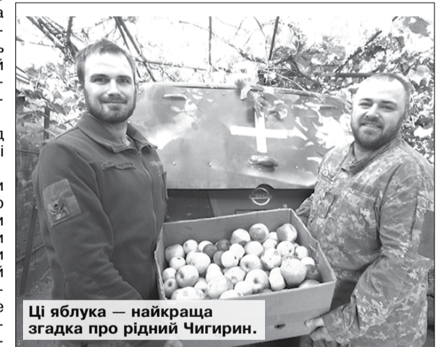
Ці яблука — найкраща згадка про рідний Чигирин.