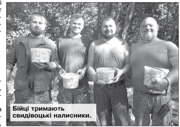
Бійці тримають свидівцькі налисники.