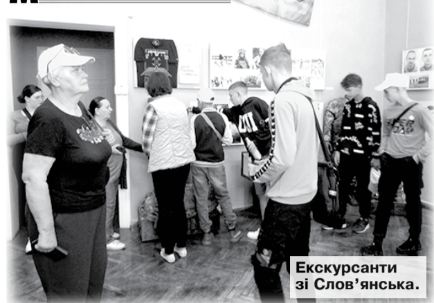
Екскурсанти зі Слов'янська.

Світлина Героїв, їхні документи, прапори військових формувань, армійська форма, особисті речі уродженців нашого колишнього вже району оживляють образи захисників, які віддали життя за Україну.