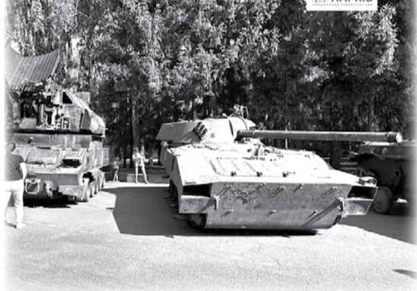
У День захисників і захисниць, День козацтва та Покрови у парку «Перемога» відкрили виставку підбитої російської техніки.