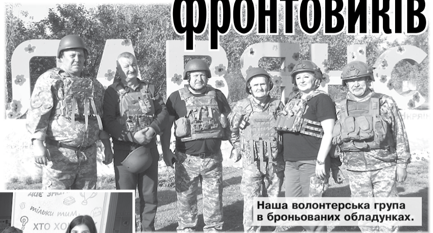
Наша волонтерська група в броньованих обладунках.