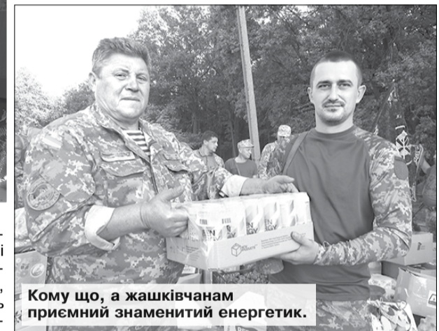
Кому що, а жашківчанам приємний знаменитий енергетик.