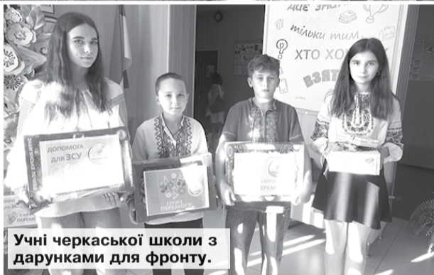
Учні черкаської школи з дарунками для фронту.