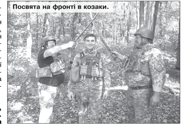
Посвята на фронті в козаки.