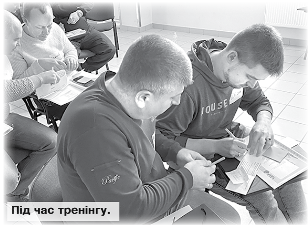
Під час тренінгу.