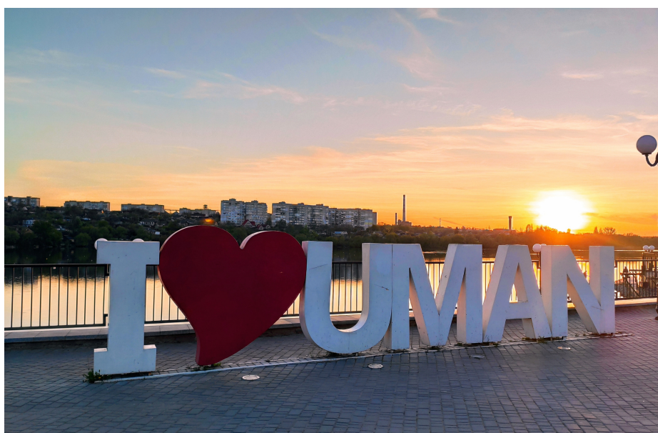
Набережна Осташівського ставу