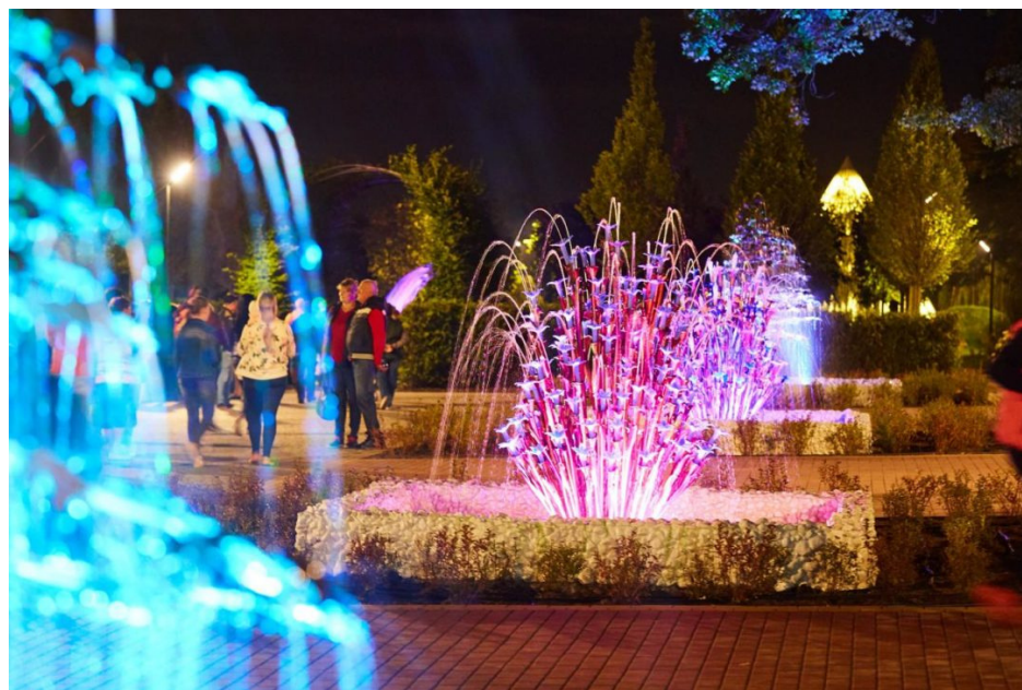
Фентезі-парк „Нова Софіївка“