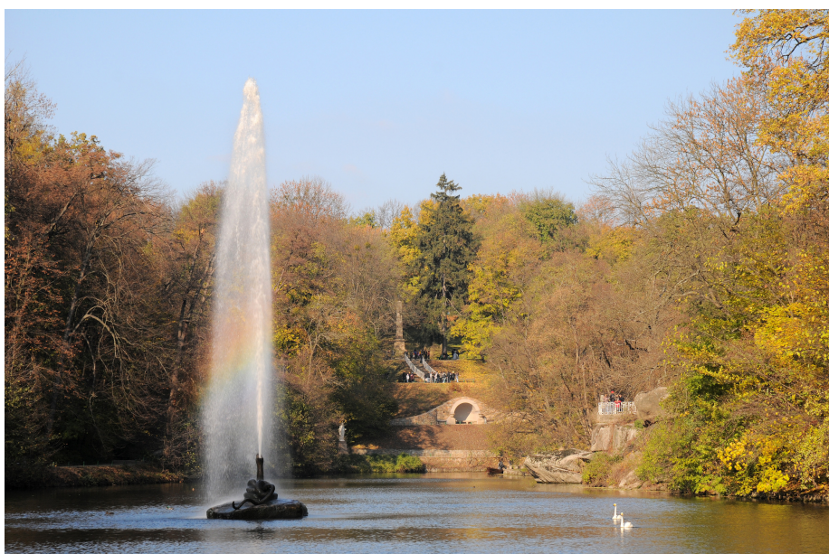
Національний дендрологічний парк „Софіївка“