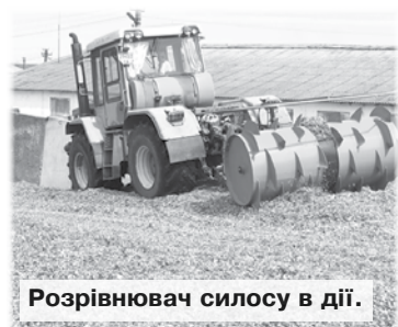
Розрівнювач силосу в дії.

Державне підприємство «Дослідне господарство «Нива» не лише обробляє землю навколо села Христинівка, а й займається тваринницькою галуззю. І підпорядковується не якомусь скоробагату чи латифундисту, а Інституту розведення й генетики тварин імені М.В.Зубця Національної академії аграрних наук України. Така хоч і довга, але повна назва цього агропідприємства. Це що стосується засновництва, підпорядкованості та юридичної залежності «Ниви». Якщо ж акцентувати на практичних її кроках, то вона з року в рік нарощує свій потенціал у царині молочного скотарства. Адресу «Ниви» добре знають не лише вітчизняні молочно-товарні комплекси, а й зарубіжні фермери та прихильники молочного скотарства.