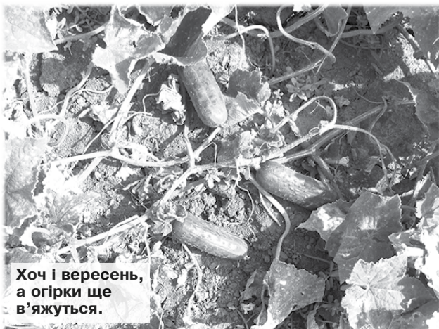
Хоч і вересень, а огірки ще в'яжуться.