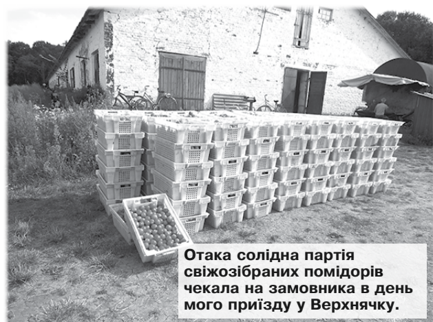
Отака солідна партія свіжозібраних помідорів чекала на замовника в день мого приїзду у Верхнячку.

Василь МАРЧЕНКО, фото автора. с.Верхнячка на Христинівщині