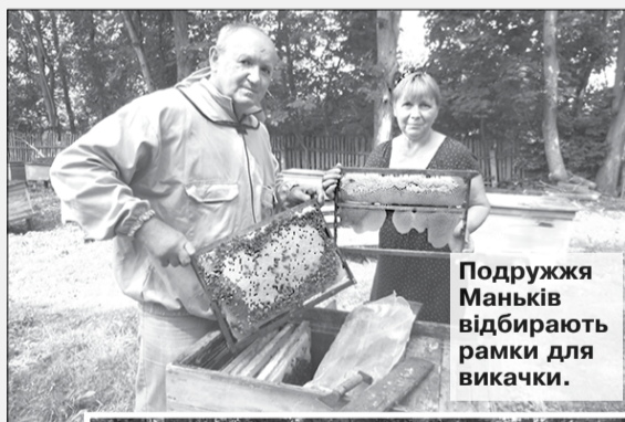
Подружжя Маньків відбирають рамки для викачки.