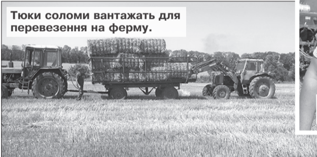
Тюки соломи вантажать для перевезення на ферму.