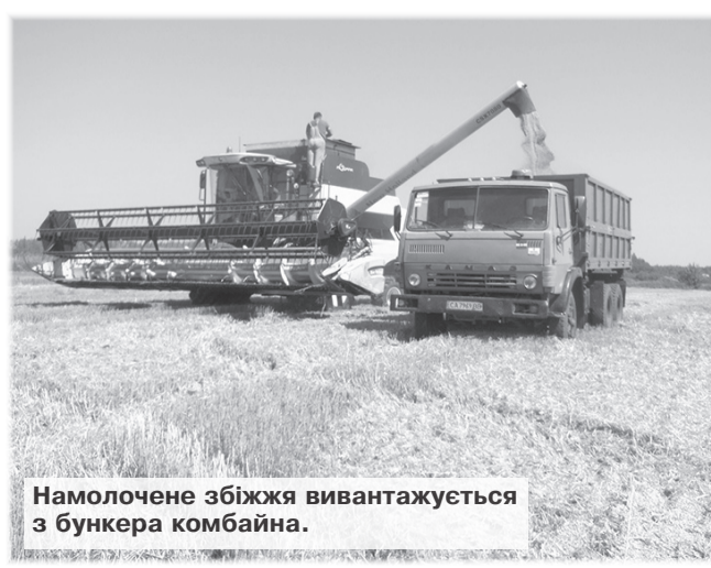
Намолочене збіжжя вивантажується з бункера комбайна.