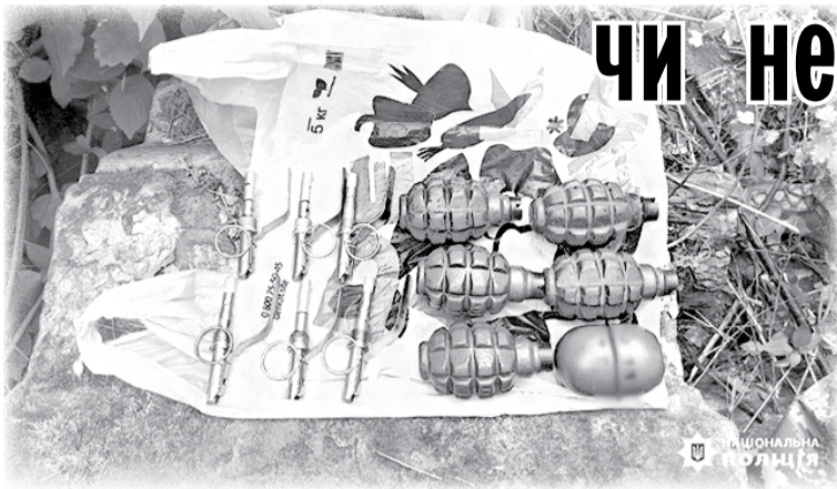
Боеприпаси, знайдені у сховку на кладовищі.