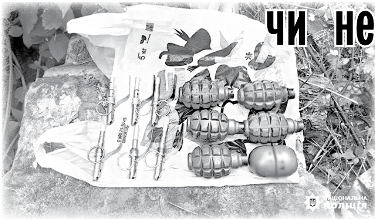
Боеприпаси, знайдені у сховку на кладовищі.