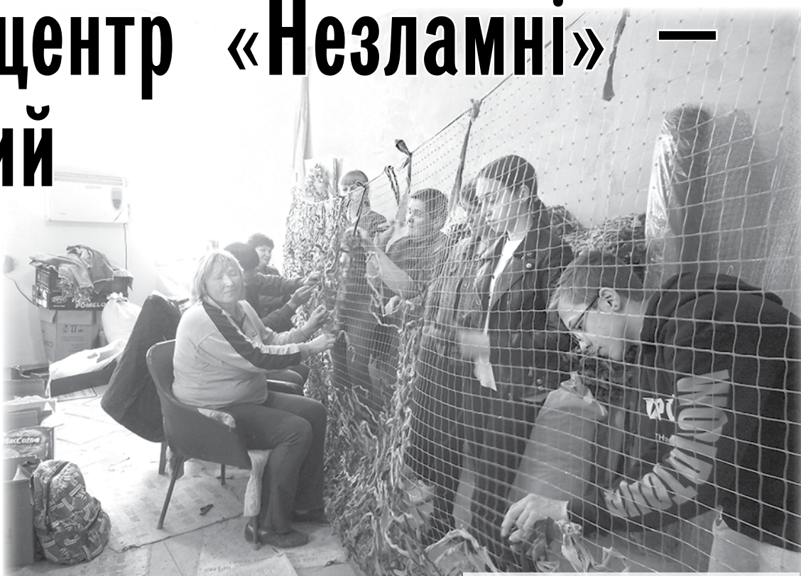
Ось так плететься маскувальна сітка.

лонтерський центр, знаходять можливість кожної днини якусь дещичку часу вділити волонтер- ським справам, відірвавшись бодай на пару годин від горо- дньо-садових клопотів. Ось і того дня, несподівано навіда- вшись у центр, ми застали там за кількома роботами чимало